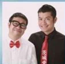
すいたんすいこう LIVE (MC・お笑い)